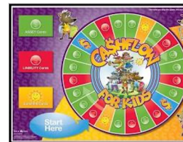
Cashflow for kids board game